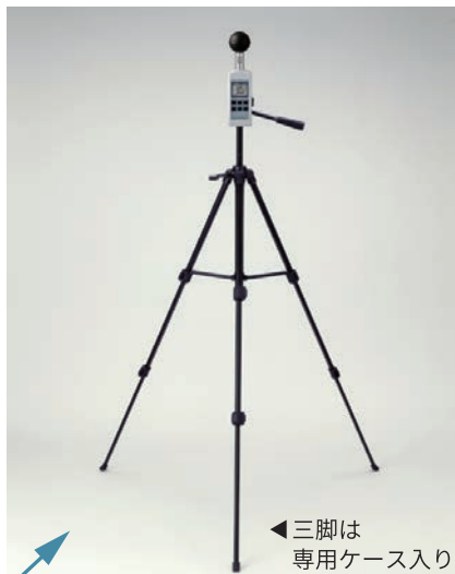
三脚は専用ケース入り

黒球温度の正確な測定には一定の高さが必要です。連続測定するためにも三脚のご使用をお勧めします。