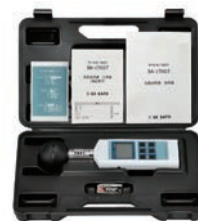
本体はハードケース入り(収納、保管用)