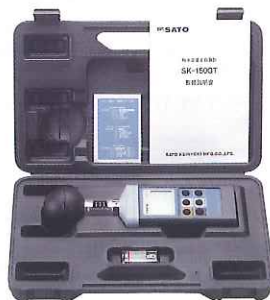
▲本体は、ハードケース入り (収納、保管用)